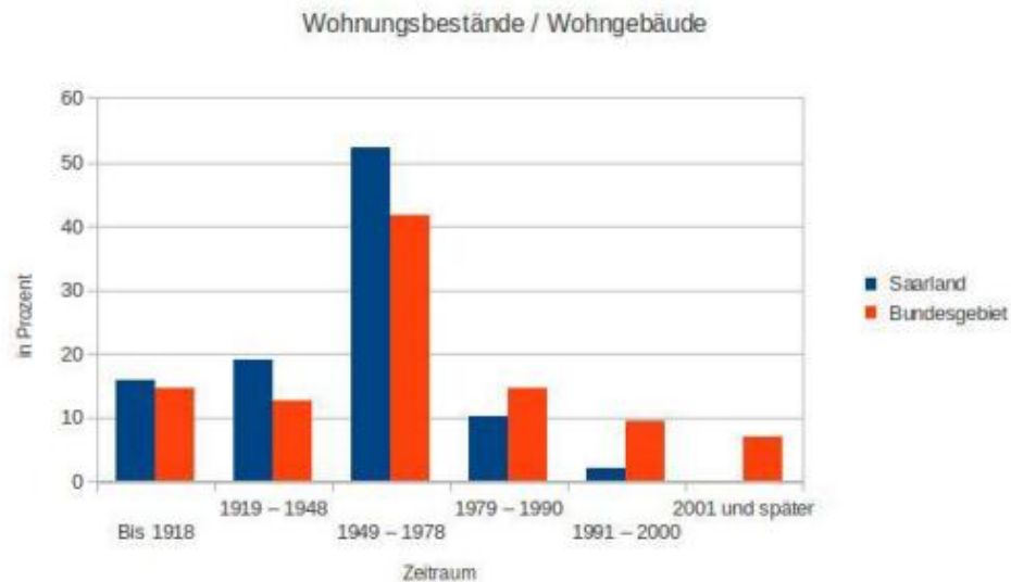
Grafik 2: Errichteter Wohnungsbestand in den Jahren 1918 bis 2010

Nach Auskunft des Deutschen Mieterbunds (MVB), Landesverband Saarland geht die Intention der verfolgten Modernisierung am Zweck vorbei. Statt mehr Wohnraum zu günstigen Preisen werden Mietaufschläge aufgrund der Modernisierung des Wohnaltbestands erhoben. Damit werden diese Wohnungen nicht „sozialer“ sondern teurer. Zudem sind die modernisierten Wohnaltbestände, so MVB, schlecht energetisch saniert, so dass zur teuren Miete auch die Betriebskosten weiter ansteigen werden (die „zweite Miete“). Insgesamt würde guter und bezahlbarer Wohnraum immer knapper werden, argumentiert der MVB.“